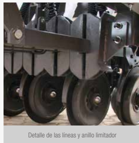
Detalle de las líneas y anillo limitador