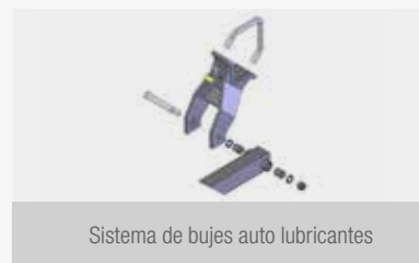
Sistema de bujes auto lubricantes