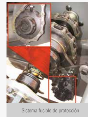
Sistema fusible de protección