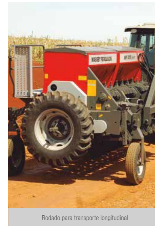
Rodado para transporte longitudinal