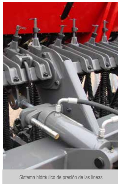
Sistema hidráulico de presión de las líneas