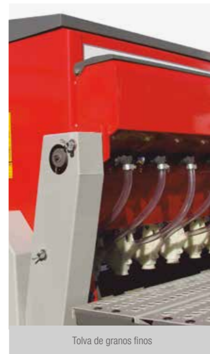
Tolva de granos finos